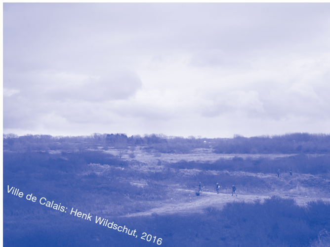
Ville de Calais: Henk Wildschut, 2016

Het vermeend intensieve theaterbezoek in Parijs blijkt mee te vallen: De gemiddelde Parijse theaterbezoeker gaat één a twee keer per jaar. Het debat over het belang van het vinden van nieuw versus bestaand publiek en het intensiveren van bezoek speelt hier in Parijs ook.