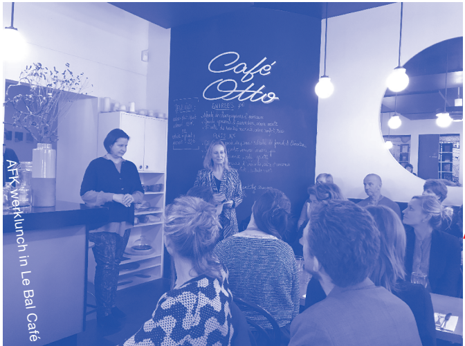
AFK-werklunch in Le Bal Café

Het live zien van het Theatre du Bouffes du Nord , waar één van de grootste theatervernieuwers van de afgelopen eeuw, Peter Brook, gewerkt heeft, was meer dan indrukwekkend. Zijn bekendste boek, The Empty Stage , heeft een grote invloed gehad op theatermakers door heel Europa. Dit oude vaudevilletheater is voor makers al 35 jaar een soort bedevaartsoort.