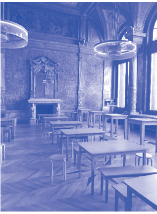
La Gaîté lyrique